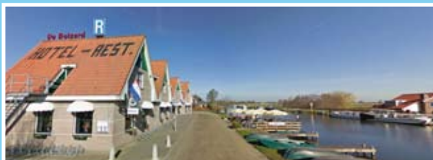
Restaurant De Buizerd: SeniorenDiners voor onze stamgasten

AANMELDEN VOOR Diners, Uitjes, Activiteiten en SeniorenZondagen: UITERLIJK 1 WEEK vooraf ☎ 072 - 534 8852