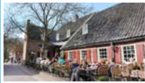
Monnickendam Brasserie De Waegh