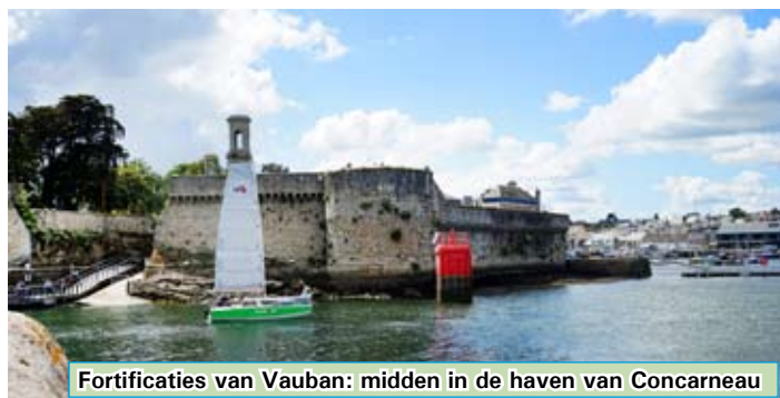
Fortificaties van Vauban: midden in de haven van Concarneau