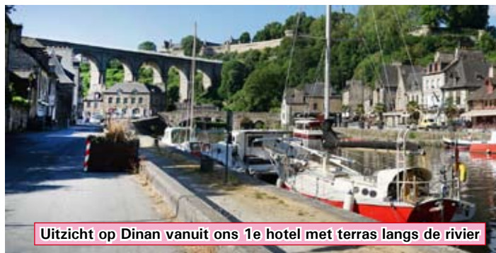
Uitzicht op Dinan vanuit ons 1e hotel met terras langs de rivier

Tot besluit een uitgebreid slotdiner aan de haven met een afscheidborrel, ter voorbereiding op de thuisreis.